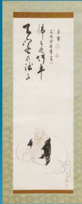
「布袋図」 円山応挙 江戸時代 天明5年（1785）

《観瀑図》は2人の高士が心地よさそうに滝を眺める作品です。《布袋図》に描かれた布袋は好々爺のように穏やかで優しい表情をしています。応挙の門人として名高い長沢芦雪と山口素絢の作品も1点ずつ展示します。