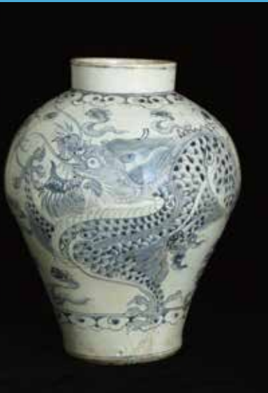
「青花龍文壺」 朝鮮 朝鮮時代（18-19世紀）

～お茶席の御案内～ 10月19、21～29日まで9日間限定でお茶席がございます。 時間は11：00～15：00です。 ただし、10月27日（日）のみ15：00～19：00となります。